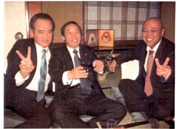
駒龍にて新年例会